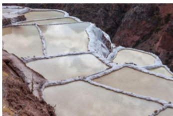
Salinas de Maras